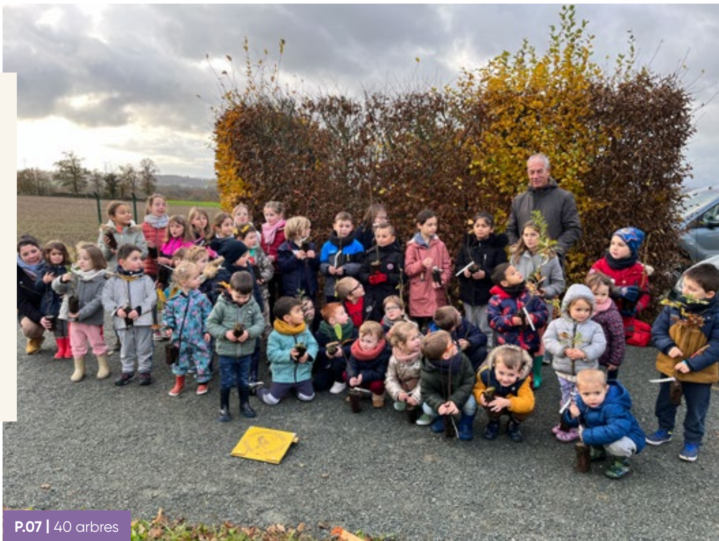
P.07 | 40 arbres