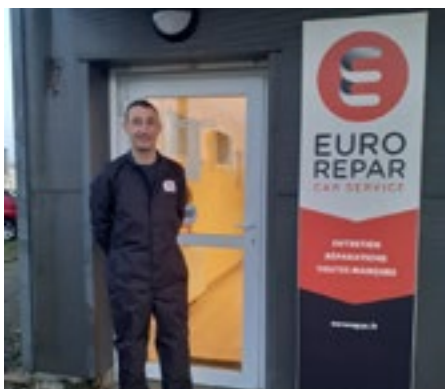
P.09 | Garage Vallée