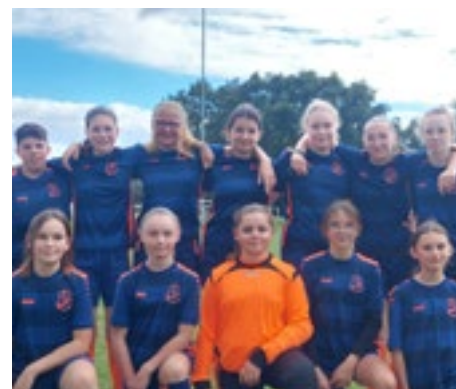
P.13 | Football féminines