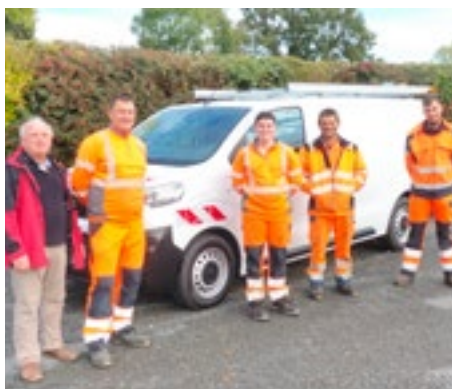
P.07 | Camion services technique